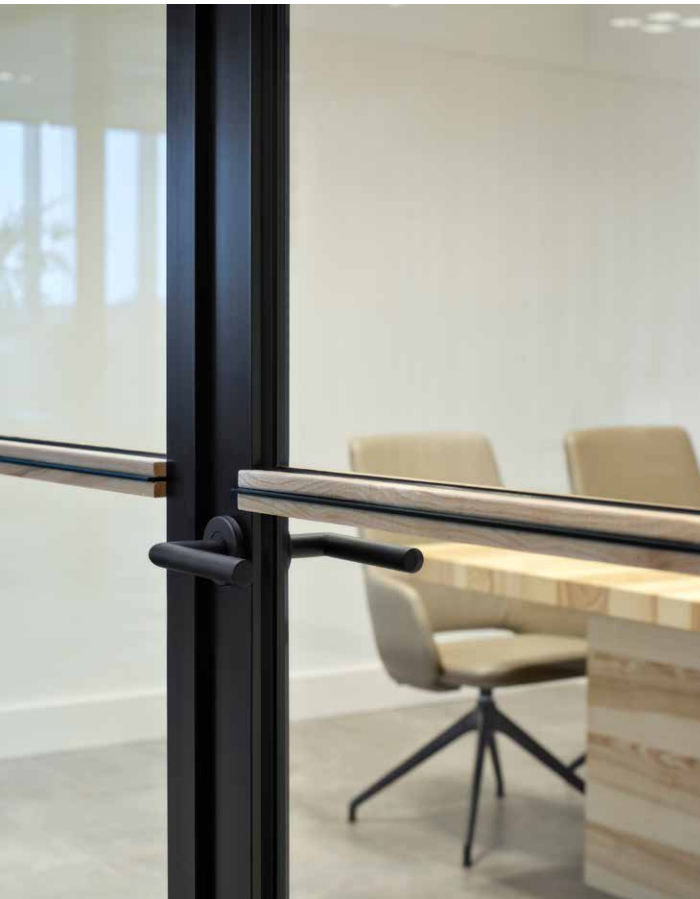
FOTO LINKSBOVEN De horizontale belijning in de centrale ruimte is warm gedetailleerd en strak, en draagt bij aan het 'trompe l'oeil' effect.